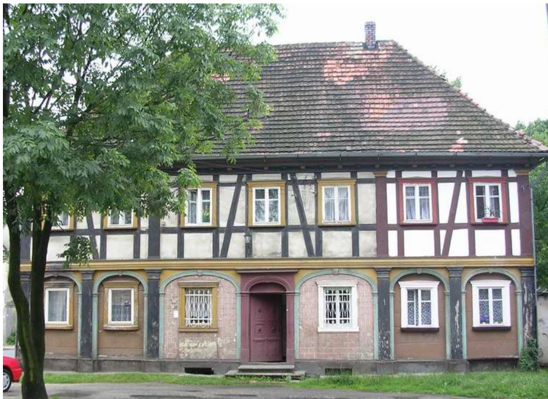
Bogatynia. Dom przysłupowo-zrębowy