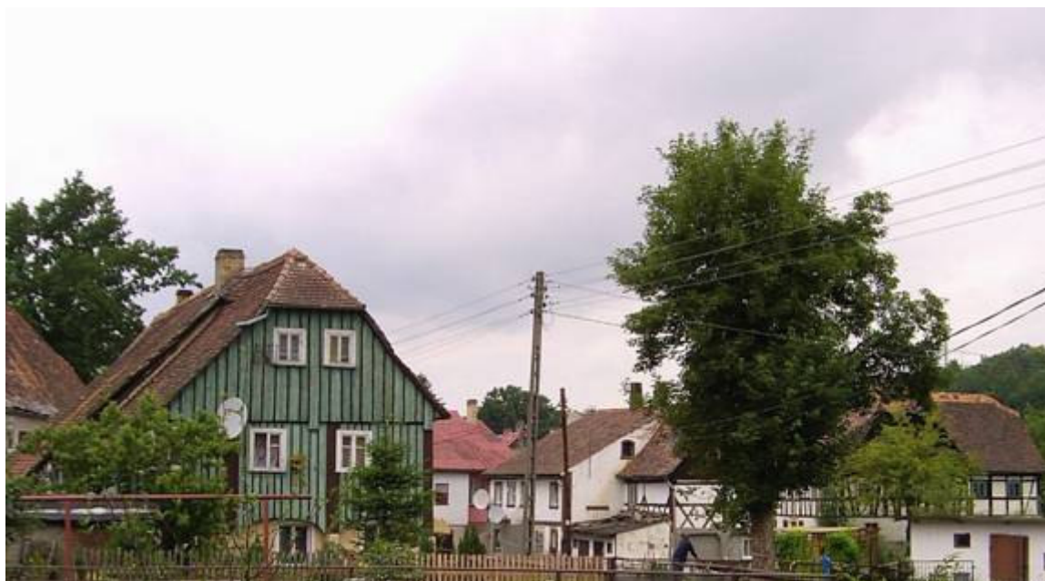
Bogatynia. Zabudowa przysłupowo-zrębowa