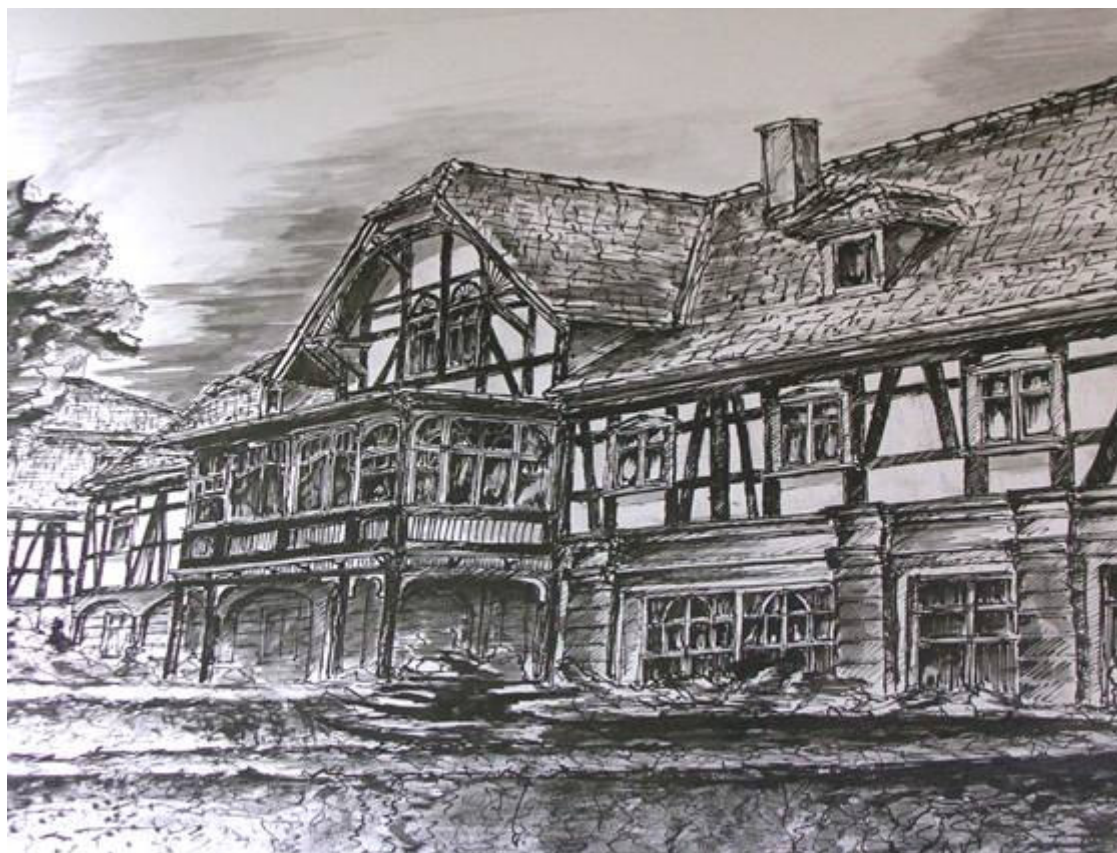
Bogatynia. Dom przysłupowo-zrębowy