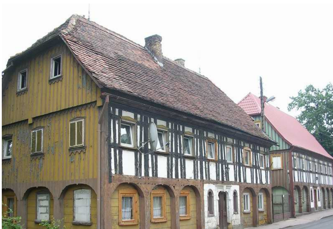
Bogatynia. Zabudowa przysłupowo-zrębowa