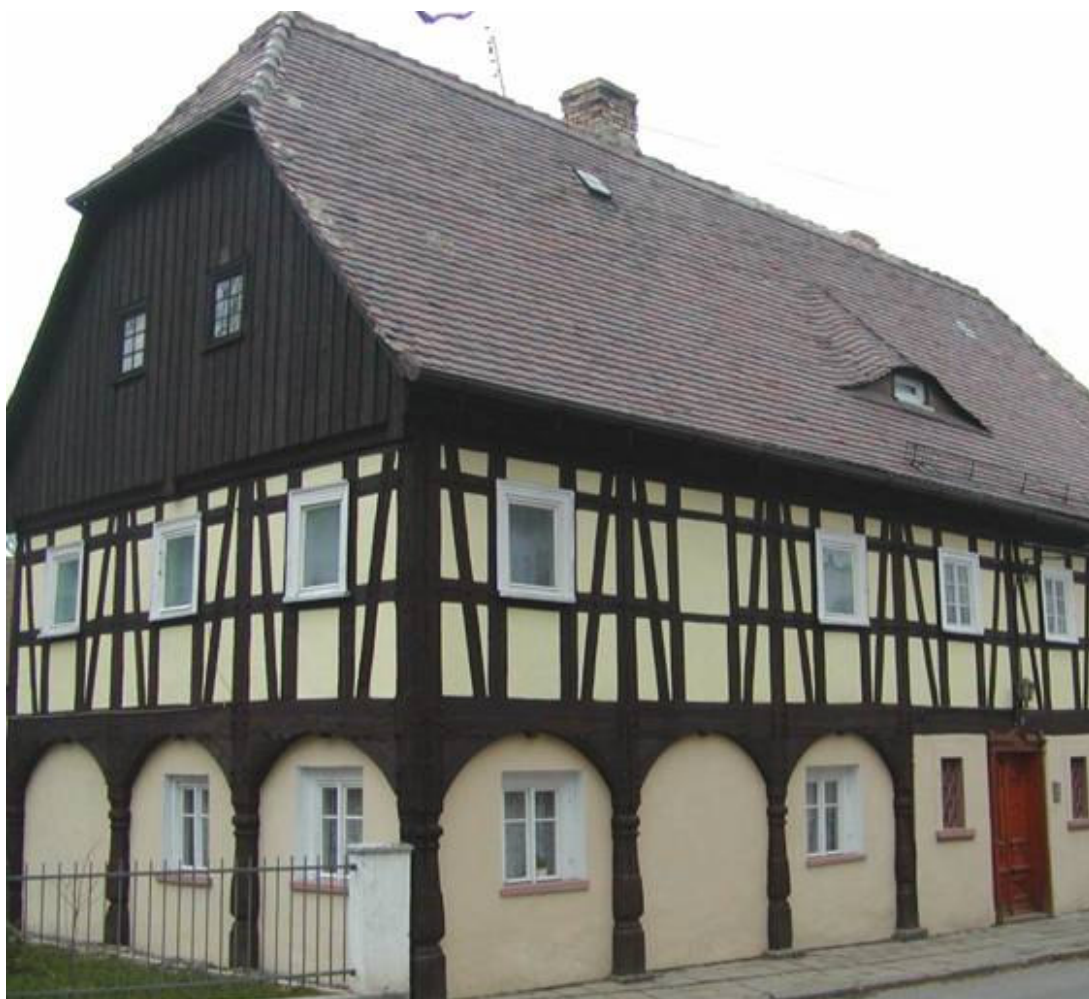
Bogatynia. Dom przysłupowo-zrębowy

płaszczyznach życia, ponad granicami państw. Transgraniczna współpraca m.in. w sferze kulturalnej, historycznej, edukacyjnej, sportowej i społecznej, jak również zainteresowanie ludności historią i przeszłością regionu wspierania nie tylko poczucie zakorzenienia, ale przede wszystkim kształtuje wspólną „małą ojczyznę”. Ma to ogromne znaczenie w obliczu obecnych trendów demograficznych oraz wzrastających napięć wewnątrz społeczeństwa. Współpraca między generacjami może stać się szansą regionu. Aby proces rozwojowy Krainy Domów Przysłupowych był kształtowany w sposób trwały i skuteczny, obok dalszych działań mających na celu optymalizację struktur organizacyjnych, ważna jest otwarta komunikacja i kooperacja transgraniczna.